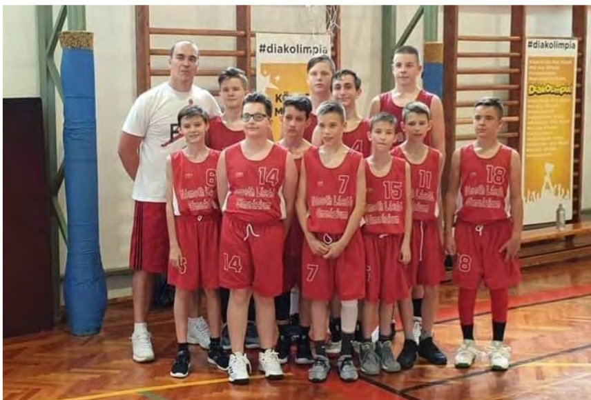
Németh László Ált. Iskola 3. kcs. – Országos Döntő 6. hely (Mezőberény)