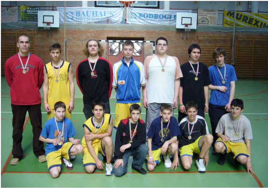
A Németh László Gimnázium országos 2. helyezett csapata – IV. k.cs.