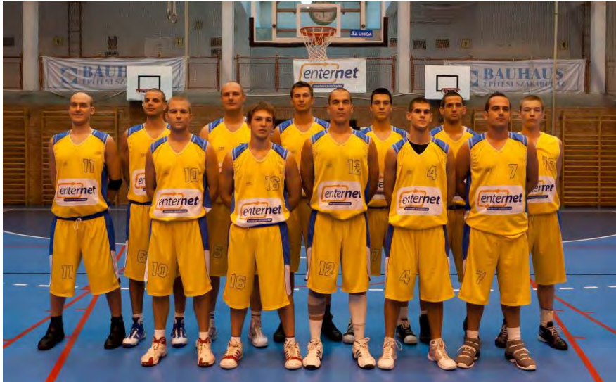
Az EnterNet Vásárhelyi KS 2010/2011-es NB I/B-s felnőtt csapata

B-Beton Bonyhád – EnterNet Vásárhelyi KS 110-76 Vásárhely: Szilágyi 20, Böszörményi 4, Schéda 17, Kukla 15, Bartucz 2, csere: Czuprák Á. 7, Rácz 4, Grezsa B. 7.