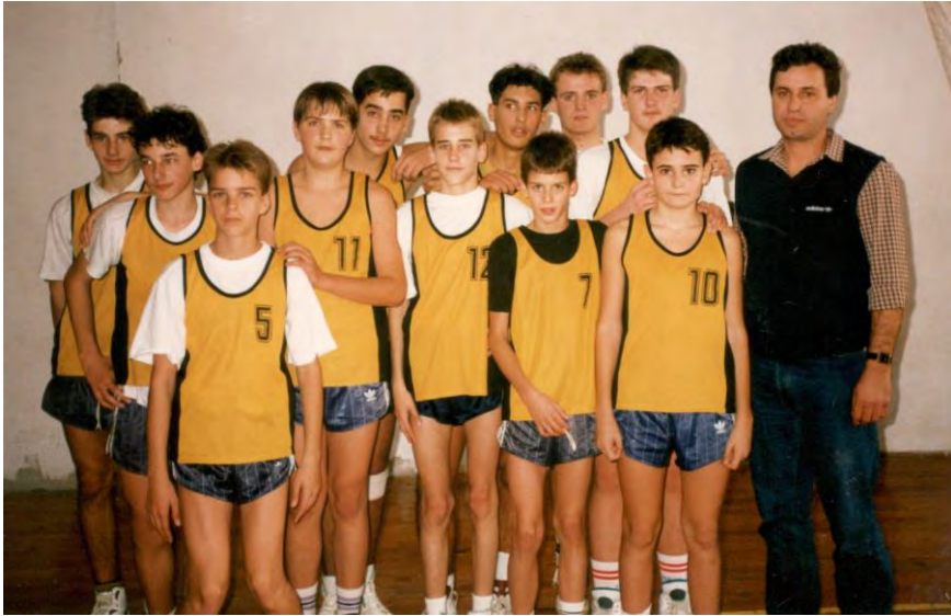
Országos Serdülő Kupa negyedöntő 2. hely – 1992.12.18.