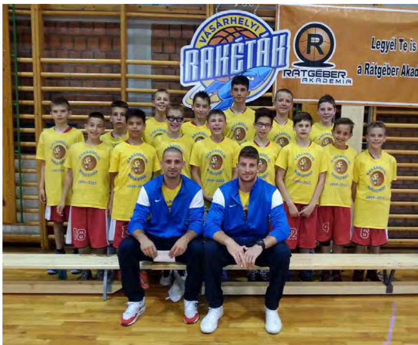
A Vásárhelyi Kosársuli Országos Bajnok u12-es csapata