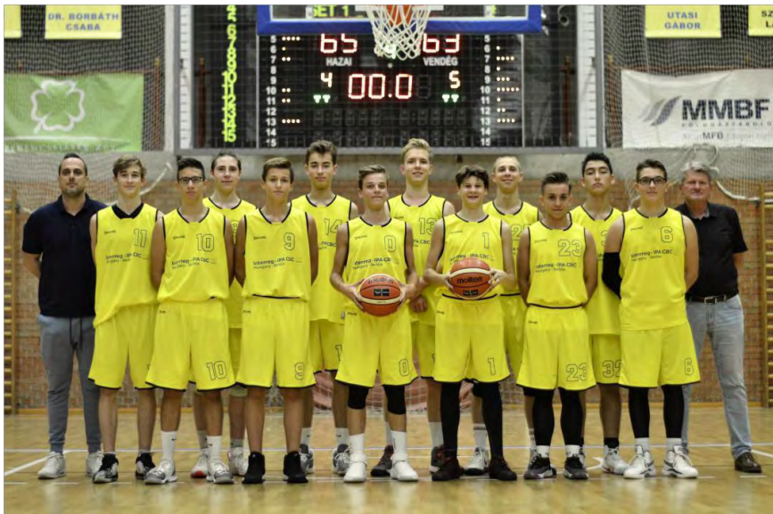
A Kosársuli 2018/19-es Országos Főtáblás u16-os csapata