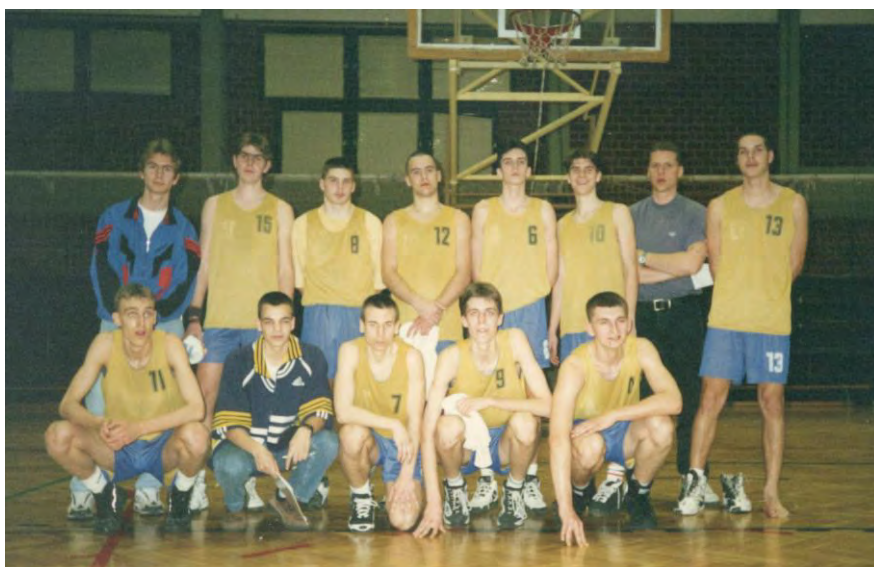
A Kosársuli Országos Ifjúsági Kupa 8. helyezett csapata