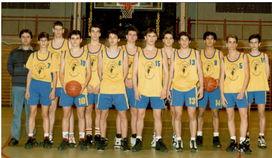
A VÁSÁRHELYI KOSÁRSULI 1994–95-ben országos döntőbe jutott kadett csapata