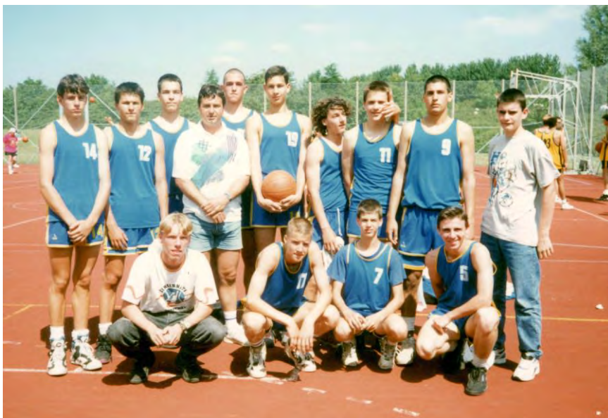
A vásárhelyi kosaras fiatalok Dániában – 1994 nyarán