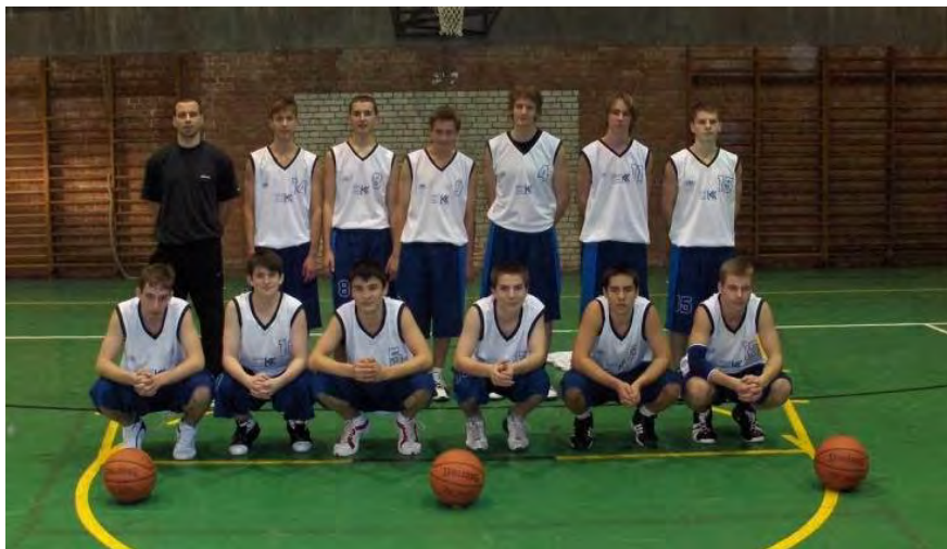
A Gregus SzKI területi bajnok, országos 8. helyezett csapata