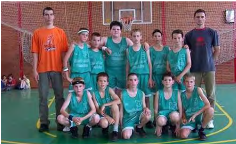
Az országos döntős Vásárhelyi Hódok