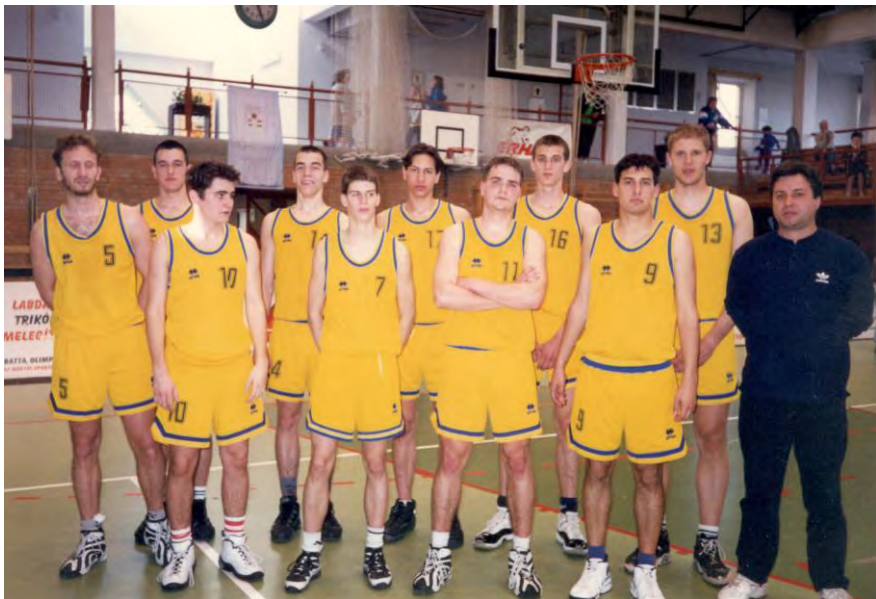
A Kosársuli bronzérmes NB II-es csapata – 1997. május

1. Biogál Debrecen, 2. Tiszaújváros, 3. Vásárhelyi Kosársuli