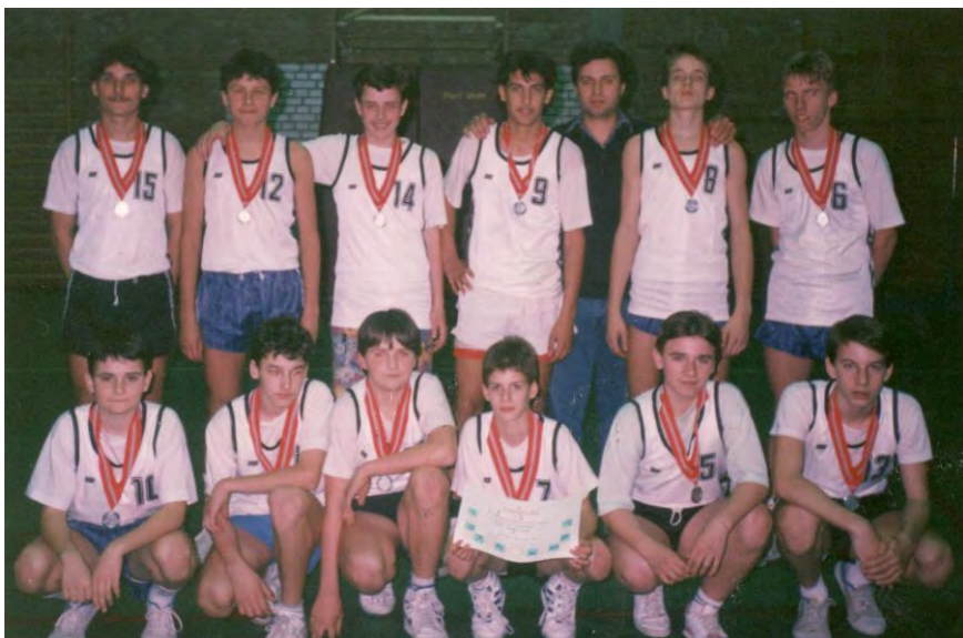
„Alapítvány Kupa” 2. hely – 1992.03.07.

1992.04.01. Szeged – Megyei Diákolimpiai Döntő (III. k.cs.):