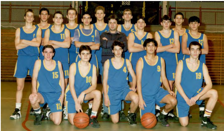
A VÁSÁRHELYI KK NB I-es ifjúsági csapata 1994-95

HKK: Kútvölgyi 7, Molnár 26, Gazdag 2, Horga 4, Imre 19, csere: Utasi 4, Apró 4, Ratkay 2, Bányai -, Szűcs -.