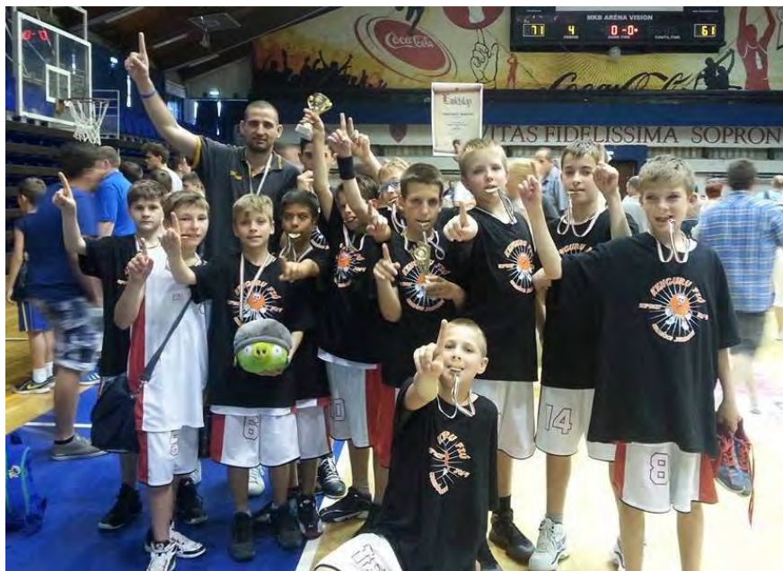
A 2014-ben országos bajnok u11-es Vásárhelyi Rakéták csapata: