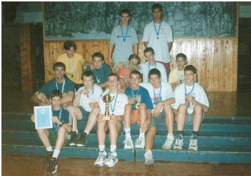
A Bethlen Gábor Református Gimnázium Országos 3. helyezett csapata