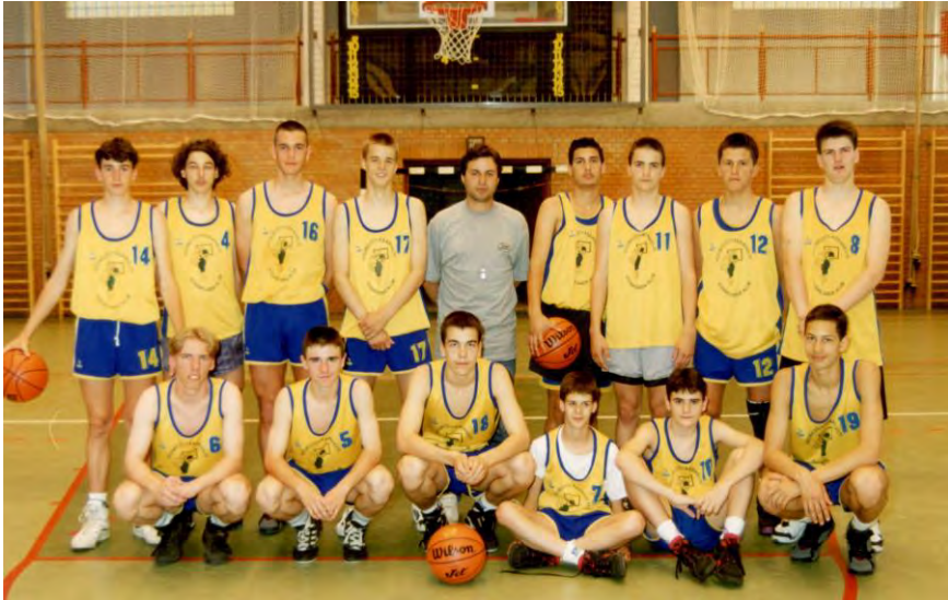
A vásárhelyi kadett csapat az 1993/94-es bajnokságban

1993 végén és 1994 elején a kadett csapat már nemzetközi mérkőzéseket is játszott az Arad (RO) és az Eszék (HR) fiataljai ellen.