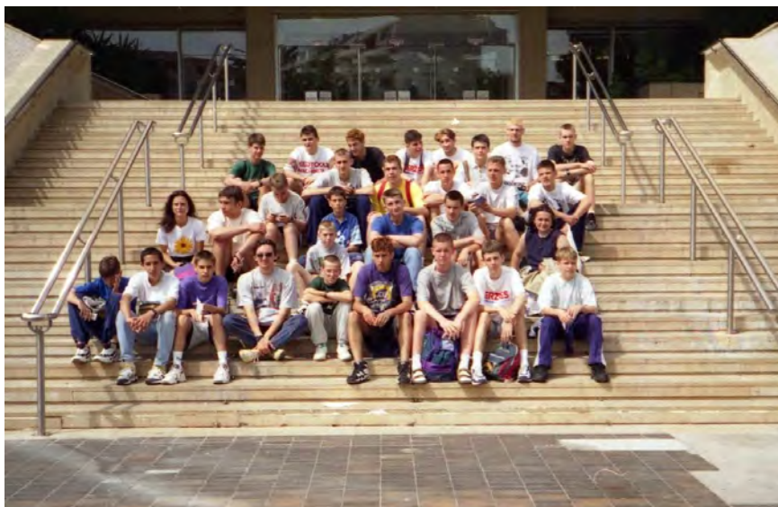
A fiúk a Cannes-i Filmfesztivál „dicsőség lépcsőin”

1996 májusában, Franciaországban jártak a Kosársuli fiataljai. Az áprilisi vásárhelyi vendéglátást viszonzva testvérvárosunk, a tengerparti Golfe-Juan Vallauris vezetői hívták meg egy hétre 3 csapatunkat. A serdülő-, kadett- és ifi kosarasok számtalan mérkőzést játszottak, és közben bejárták a francia Riviérát – Cannes és Monaco között.