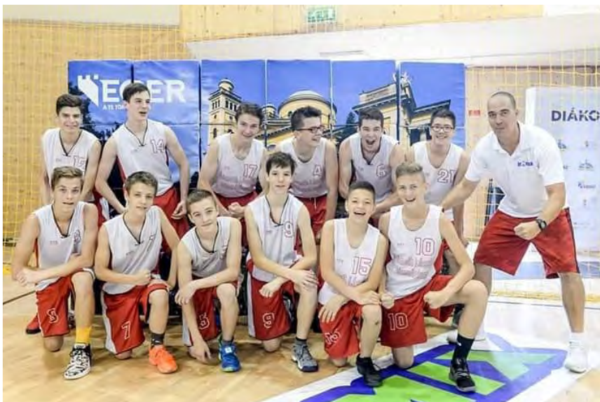
Németh László Általános Iskola 4. kcs. – Országos Döntő 5. hely (Eger)

A 2018/19-es tanév diákolimpiai küzdelmei során a Németh László Gimn. és Ált. Isk. csapata mindkét megyei döntőt megnyerte, majd a területi döntőkön is első lett, bejutva ezzel az Országos Döntőbe.