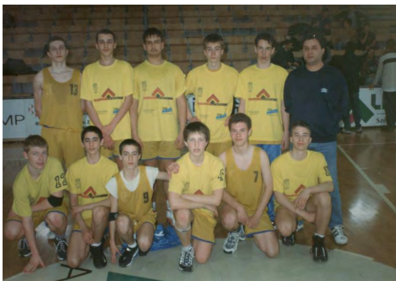
A Kosársuli országos 7. helyezett serdülő csapata

Hmvhely: Haddad 4, Martonosi -, Mihalkó Cs. 8, Szent 16, Fülöp 21, csere: Szilágyi G. 6, Kis T. 10, Kováts 17, Beznóczky 4, Aradán -.